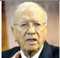
CAID ESSEBSI Béji Parti Nidaa Tounes