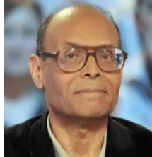
MARZOUKI Moh. Moncef Congrès pour la République