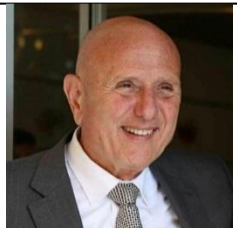
CHEBBI Ahmed Néjib Part Al-Jomhouri