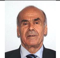
ESSID Bachir Mouvement Mourabitoun