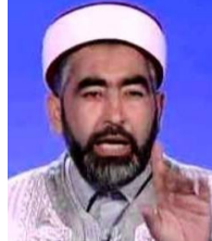
ALMI Adel, Association Tawia wa islah