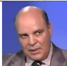
JLASSI Bahri Parti de l'ouverture et de la fidélité tunisienne