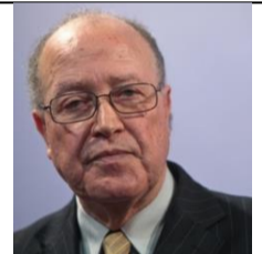
BEN JAAFER Moustapha Parti Ettakatol