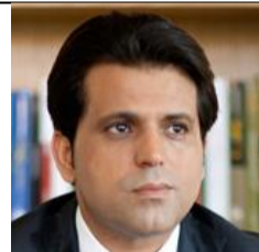
RIahi Slim Union nationale libre